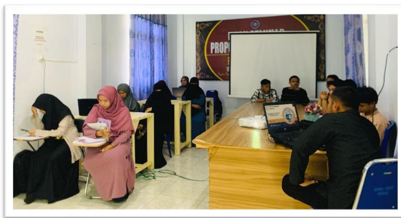
Gambar 1. Pelaksanaan Kegiatan

Selama tahap ini, mahasiswa akan dibimbing langsung oleh fasilitator untuk memastikan bahwa setiap mahasiswa memahami cara menggunakan tools tersebut dengan baik. Peserta juga diminta untuk menyelesaikan tugas berupa penulisan artikel jurnal dengan memanfaatkan tools yang telah dipelajari.