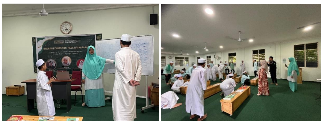
Gambar 1. Dokumentasi Kegiatan

Selain itu, terdapat perkembangan signifikan dalam aspek kepercayaan diri santri. Jika pada awal kegiatan beberapa peserta terlihat ragu-ragu dan kurang berani membaca teks Arab secara terbuka karena takut melakukan kesalahan, maka di akhir sesi, mayoritas peserta telah mampu membaca dengan lebih fasih, artikulatif, dan penuh keyakinan. Perubahan ini menjadi bukti bahwa pendekatan pelatihan yang bersifat partisipatif dan komunikatif mampu memberikan dampak positif tidak hanya secara kognitif, tetapi juga secara afektif dan psikologis.