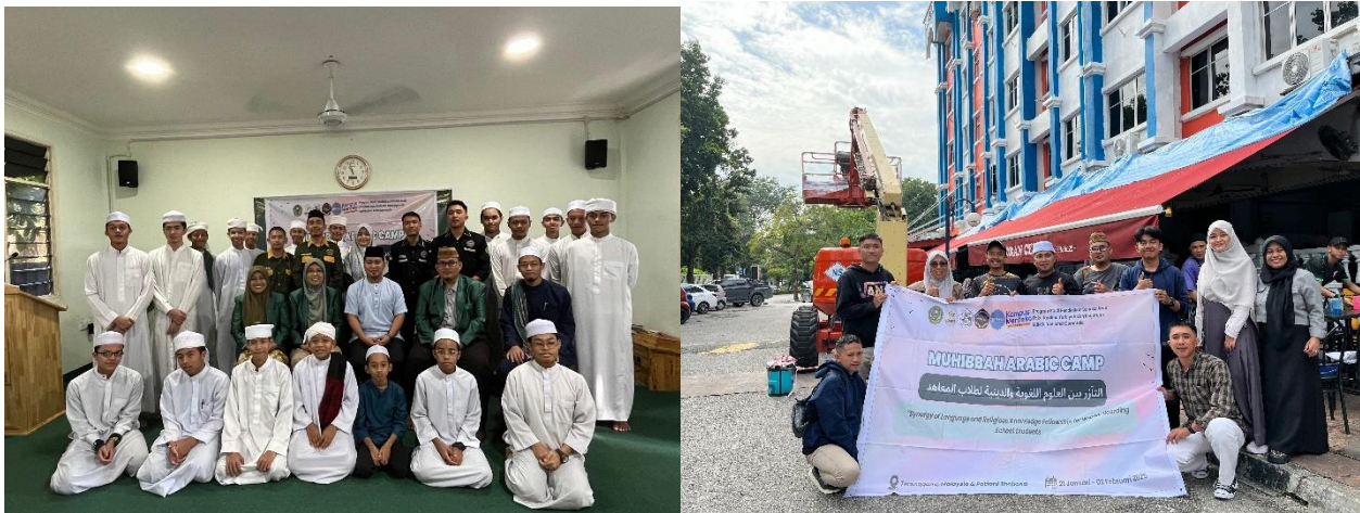
Gambar 1. Pelaksanaan Kegiatan

Sebelum program dimulai, sebagian besar santri masih mengalami kesulitan dalam mengungkapkan gagasan dalam bahasa Arab, terbata-bata dalam berbicara, dan belum mampu menggunakan struktur kalimat dengan baik. Namun, seiring berjalannya program dengan metode yang komunikatif dan berbasis praktik, santri mulai menunjukkan perkembangan yang sangat menggembirakan. Mereka tidak hanya lebih lancar dalam menyusun kalimat, tetapi juga lebih percaya diri dalam berinteraksi menggunakan bahasa Arab dalam konteks kehidupan sehari-hari.