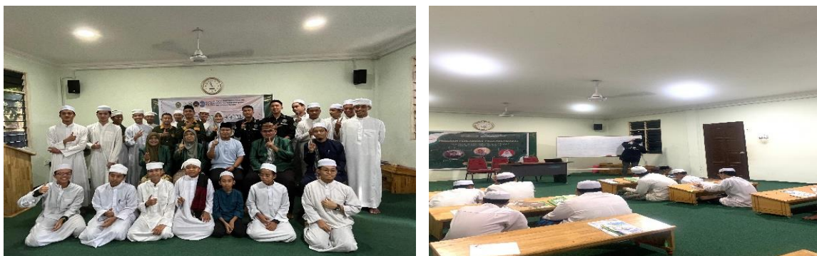
Gambar 1. Dokumentasi Kegiatan

Setelah sesi pengantar, kegiatan dilanjutkan dengan latihan intensif Maharatul Kalam melalui metode simulasi. Para santri dipandu untuk mempraktikkan percakapan dalam berbagai konteks nyata seperti menyampaikan ceramah singkat, memberi salam dan perkenalan, berdialog dalam forum publik, hingga menyampaikan materi agama secara interaktif kepada masyarakat. Dalam pelaksanaan simulasi ini, santri dibagi ke dalam kelompok kecil untuk memastikan setiap individu memiliki peran aktif. Setiap kelompok mendapatkan skenario pengabdian yang berbeda, misalnya: berbicara di masjid, memberikan materi keagamaan di sekolah, atau berdakwah kepada masyarakat umum dalam forum informal.